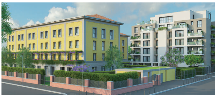
Residenza Sanitaria Assistenziale Classe SC.